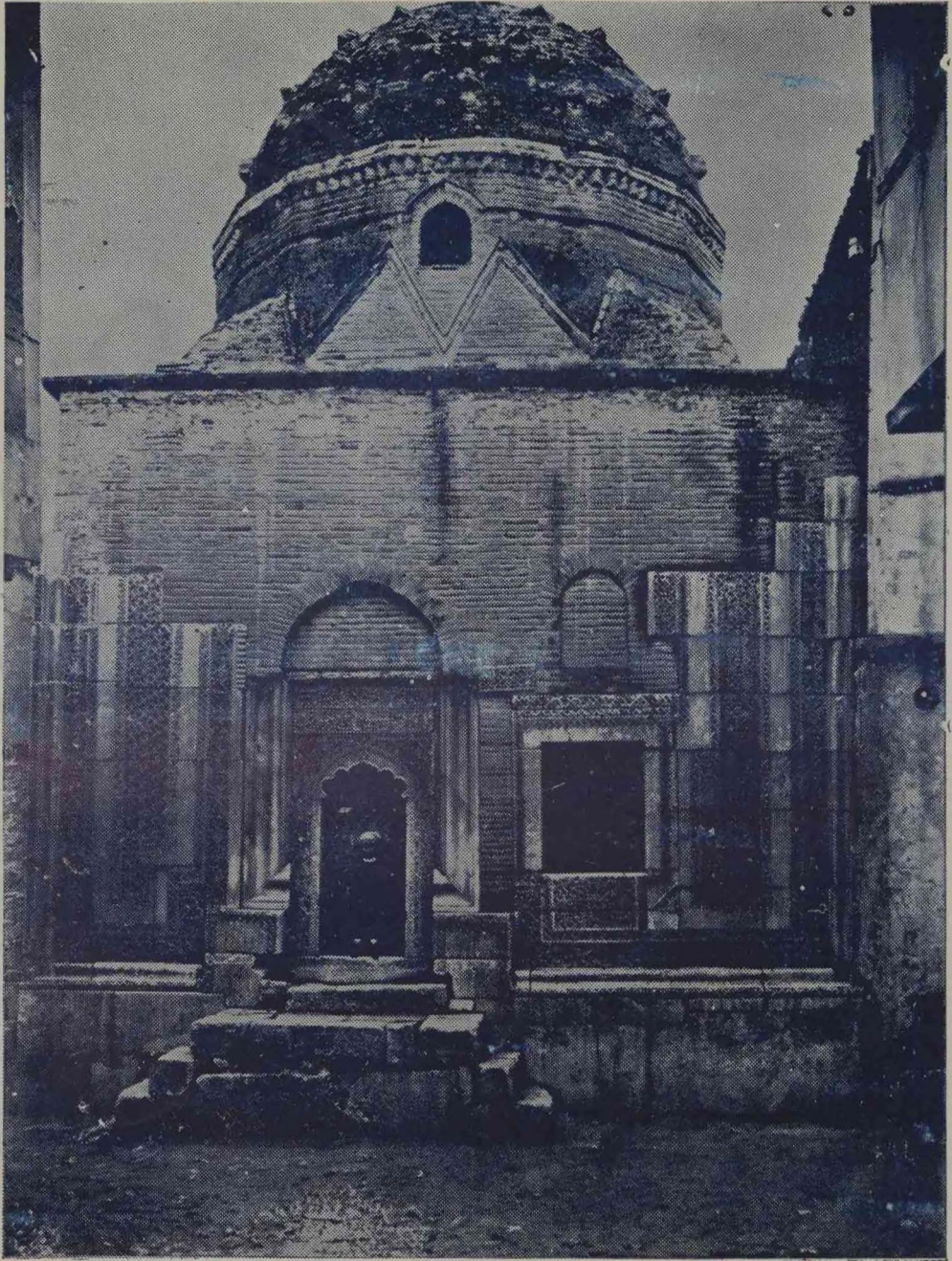
Konyada Hasbey Darulhuffazi