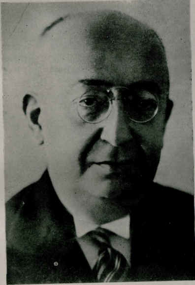
Başvekil Refik Saydam