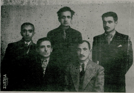
Kitapsaray ve yayım komitesi

Tilalo ve Çınar köylerindeki birer okuma odası açmış bu odaların bütün ihtiyaçlarını temin etmiş. Devam eden 60 köylü çocuğuna kitap ve ders malzemesi vermiş. Karakilise ve mermer köylerindeki birer okuma odası açmak üzeredir.