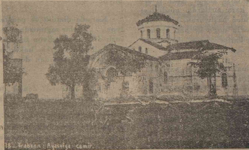
Trabzon Ayasofya Camii

Trabzon nüfusu bundan 75 sene evvel, ki kanalın açılmasından iki sene sonraya rastlar, 33,000 kişi imiş. Sonraları 70 bine çıkmış. Transit ti- caredi liman hareketlerinin yarısını geçiyormuş. İthalât, ihracattan bir mişli fazla imiş . . . Sonraları yaban- cı rekabetler ve hele, Avrupa'dan yaptığı ilk borçlarla Trabzonda bir liman yapmayı düşünmüş olan, fakat bu düşüncesini gerçekleştirmeyi bir tür türlü beceremiyen İmparatorluk ida- resinin ihmali, bu ticareti azalta azal-