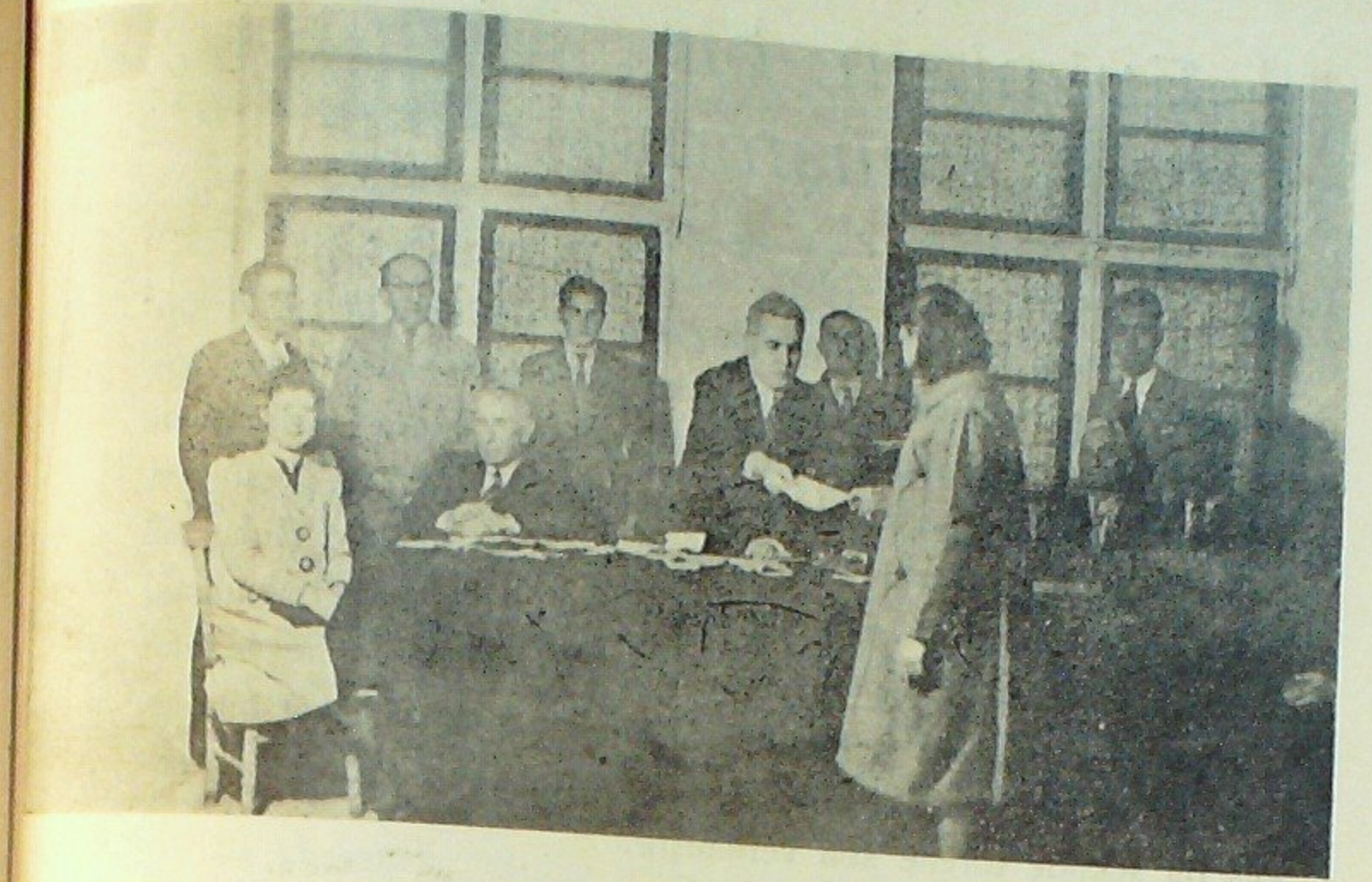
Evimiz kurslarından mezun olanlara vesikaları verilirken