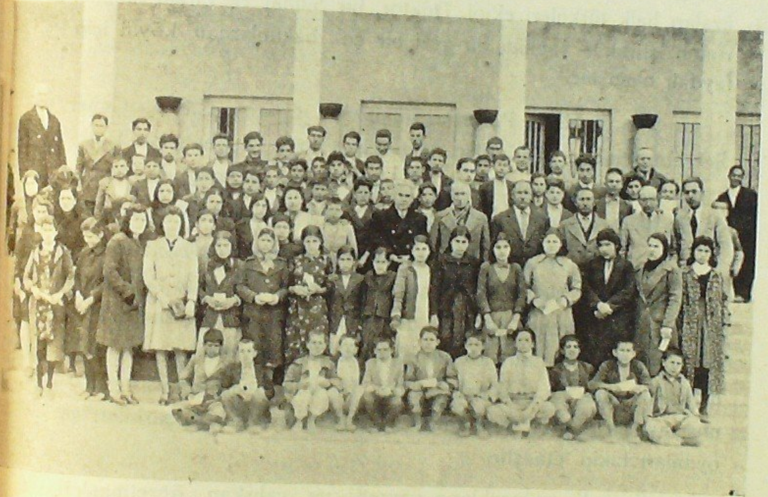
Evimiz kurslarından mezun olanlar Halkevinin önünde öğretmenleriyle beraber