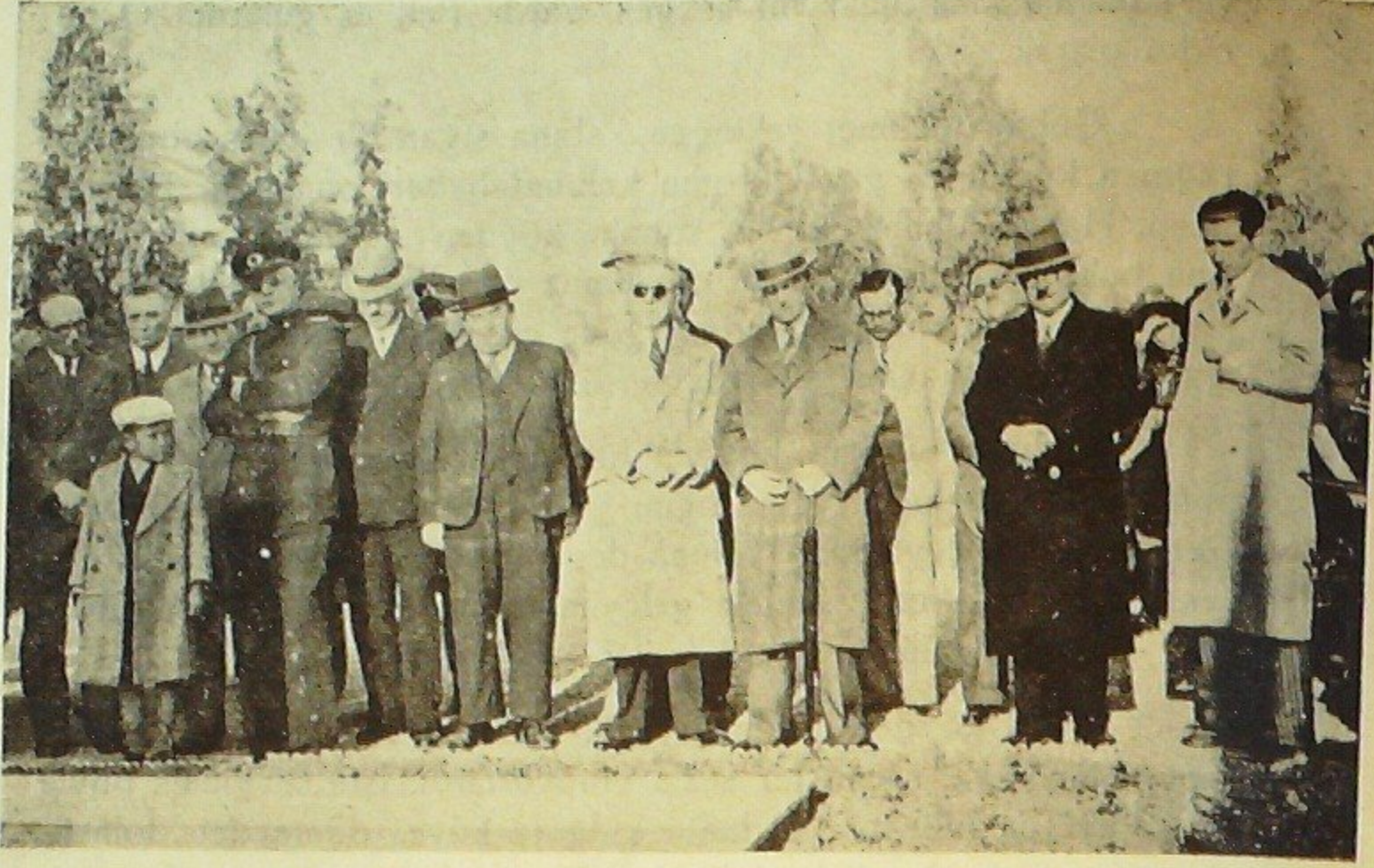
15 Mart Atatürk gününde parkta yapılan törenden bir görünüş