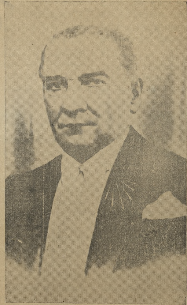
YAŞAYAN BÜYÜK ÖLÜ EBEDİ ŞEFİMİZ ATATÜRK

Cilt : 5 ( 1 ci ve 2 ci TEŞRİN 1941 ) Sayı : 51—52