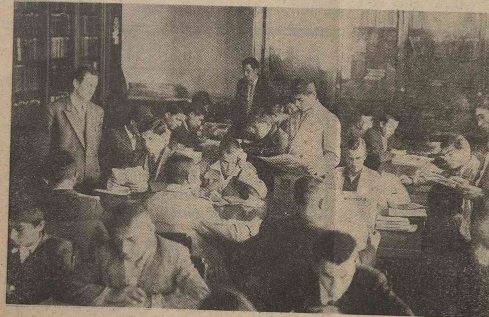
Gece Saat 22 ye kadar Okuyucularına açık bulunan Adana Halkevi Kütüphanesinden bir görünüş

Dalkavukluk, piç ruhtur; Dalkavuk veledi zina..