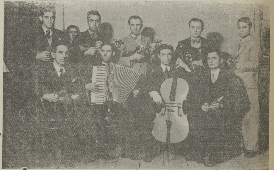
Ar Şübemizin verdiği Konser intibalarından