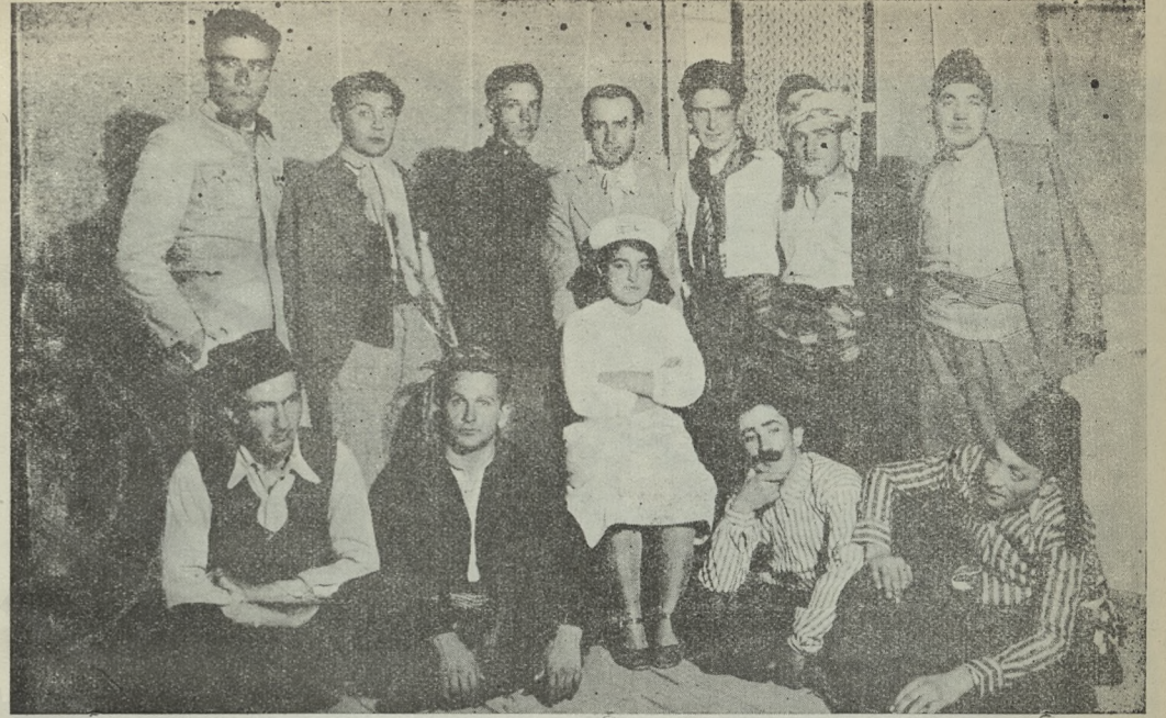
Gösterid Şübemiz tarafından evvelce temsil edilen (Tarih Utandı) piyesinden bir sahne