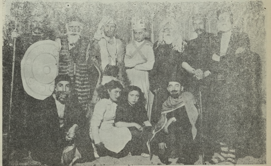
Gösterid Şübemiz tarafından temsil edilen (Çoban) piyesinden bir sahne