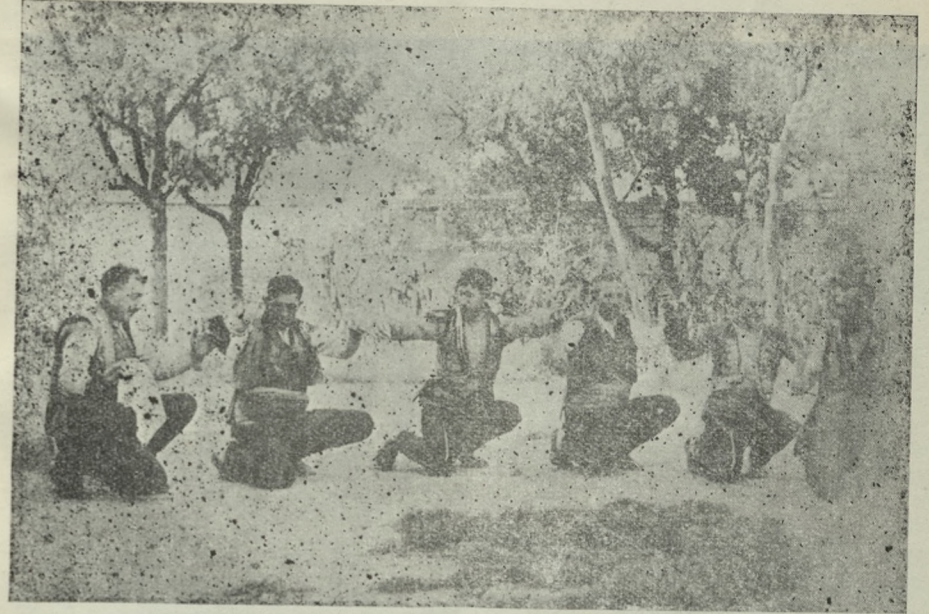
Çorum Halayı figürlerinden :