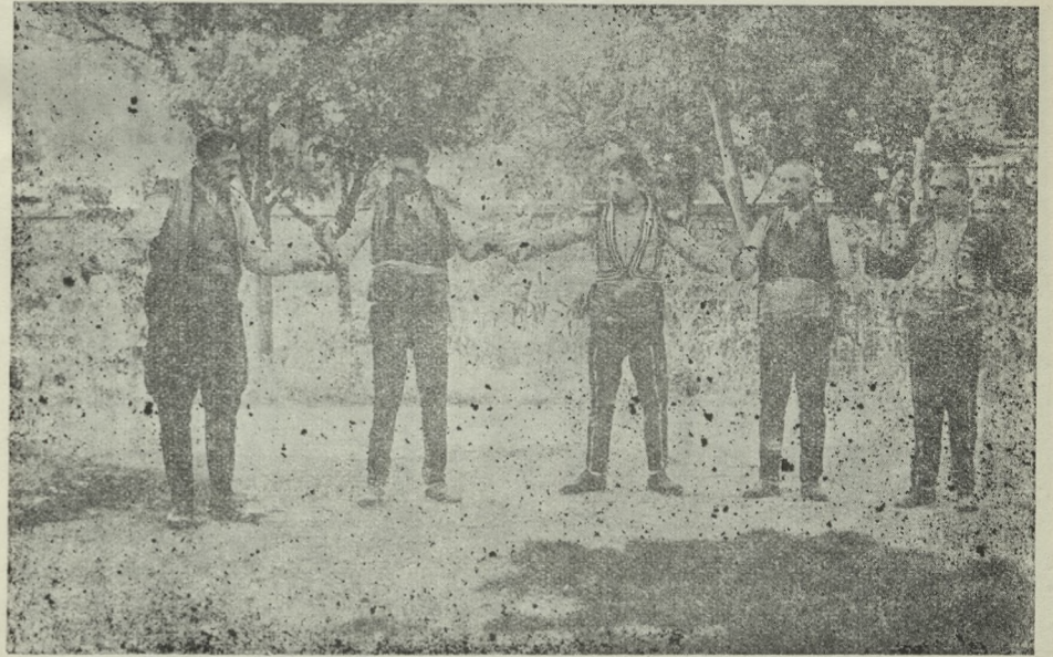
Çorum Halayı figürlerinden: