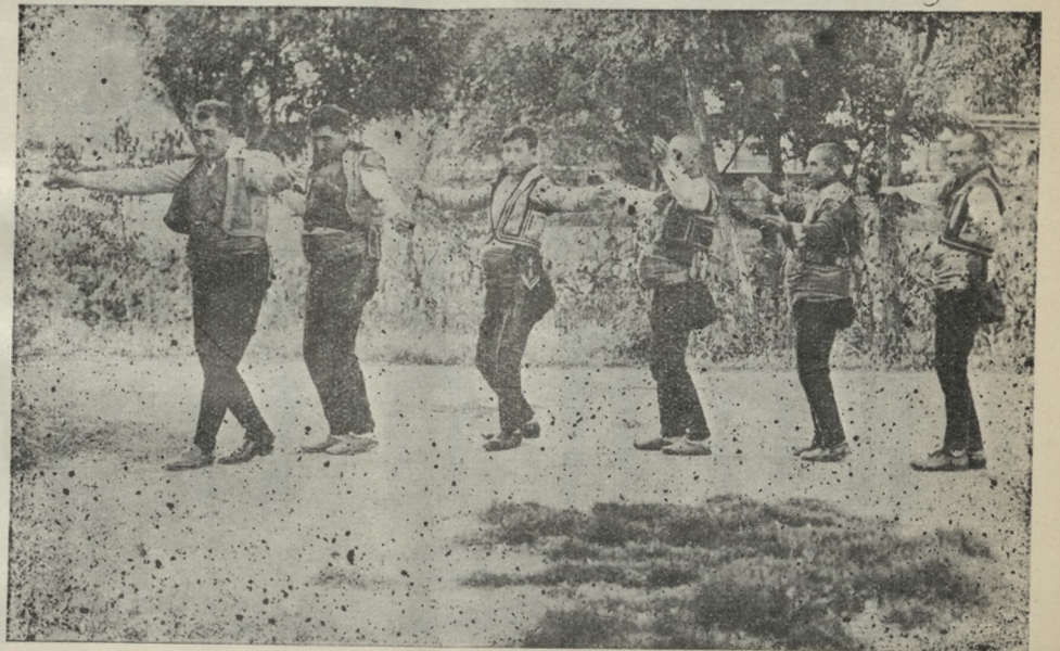
Çorum Halayı figürlerinden :