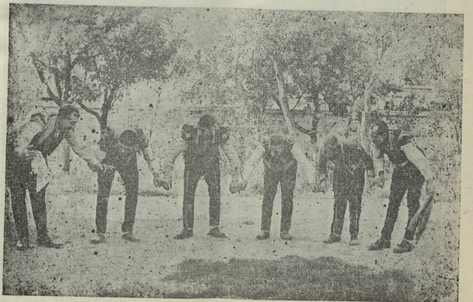
Çorum Halayı figürlerinden :