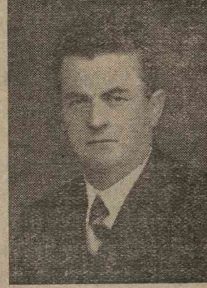
Divriğin çalışkan kaymakamı

Toplantıyı Halkevi Reisimiz Ahmet Göze veciz bir hitabeyle açmış-